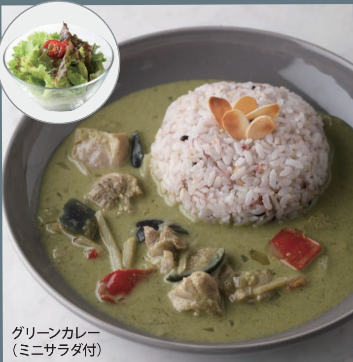
グリーンカレー (ミニサラダ付)