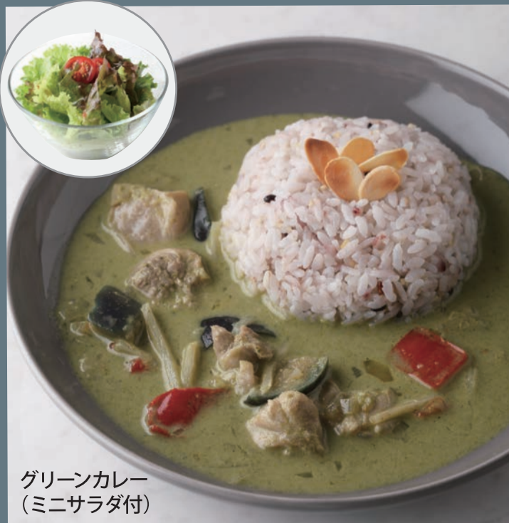
グリーンカレー (ミニサラダ付)