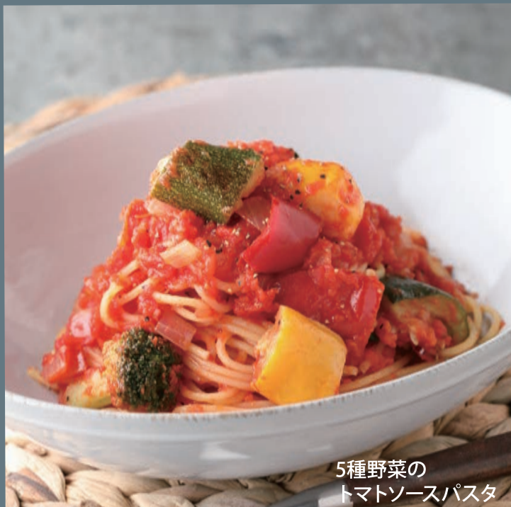
5種野菜の トマトソースパスタ