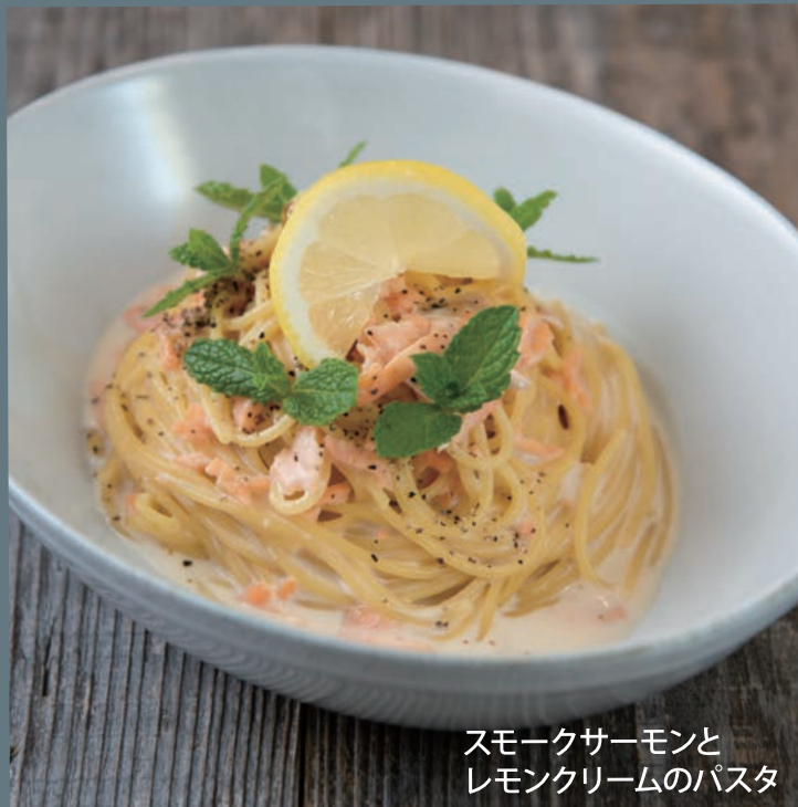
スモークサーモンと レモンクリームのパスタ