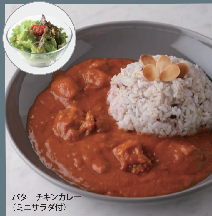
バターチキンカレー (ミニサラダ付)