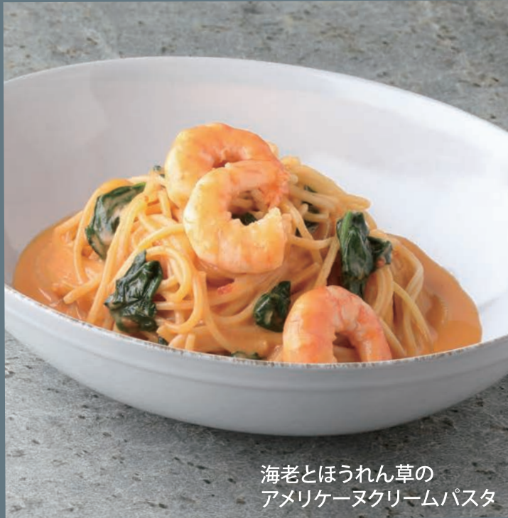
海老とほうれん草の アメリカーナクリームパスタ