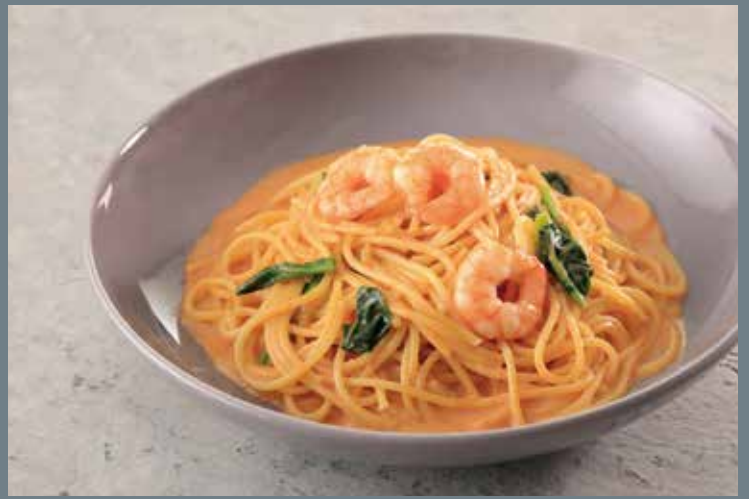
海老とほうれん草のアメリカヌクリームパスタ