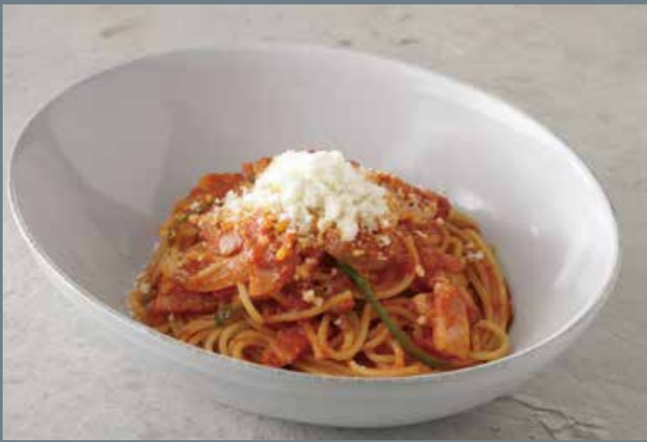
イベリコ豚ベーコンのナポリタン

※表示価格は税込みです。 ※店内飲食とお持ち帰りは税込み同一価格です。 税抜価格は異なります。 ※お米は国産を使用しています。 ※写真はイメージです。 ※テイクアウト用のスプーン・フォーク・ナイフが不要のお客様はお申し付けください。