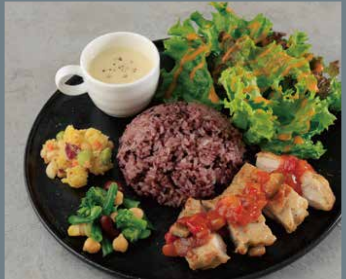
グリルチキンと黒米ごはんのカフェプレート (トマトと野菜の具沢山ソース) ※はちみつを使用しています。