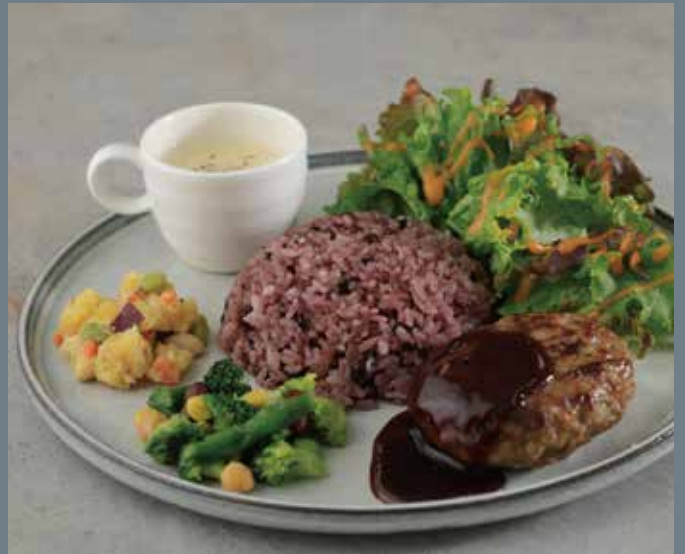
ビーフハンバーグと黒米ごはんのカフェプレート (デミグラスソース) ※はちみつを使用しています。