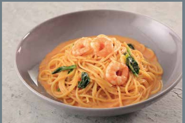
海老とほうれん草のアメリケーヌクリームパスタ