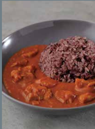
バターチキンカレー