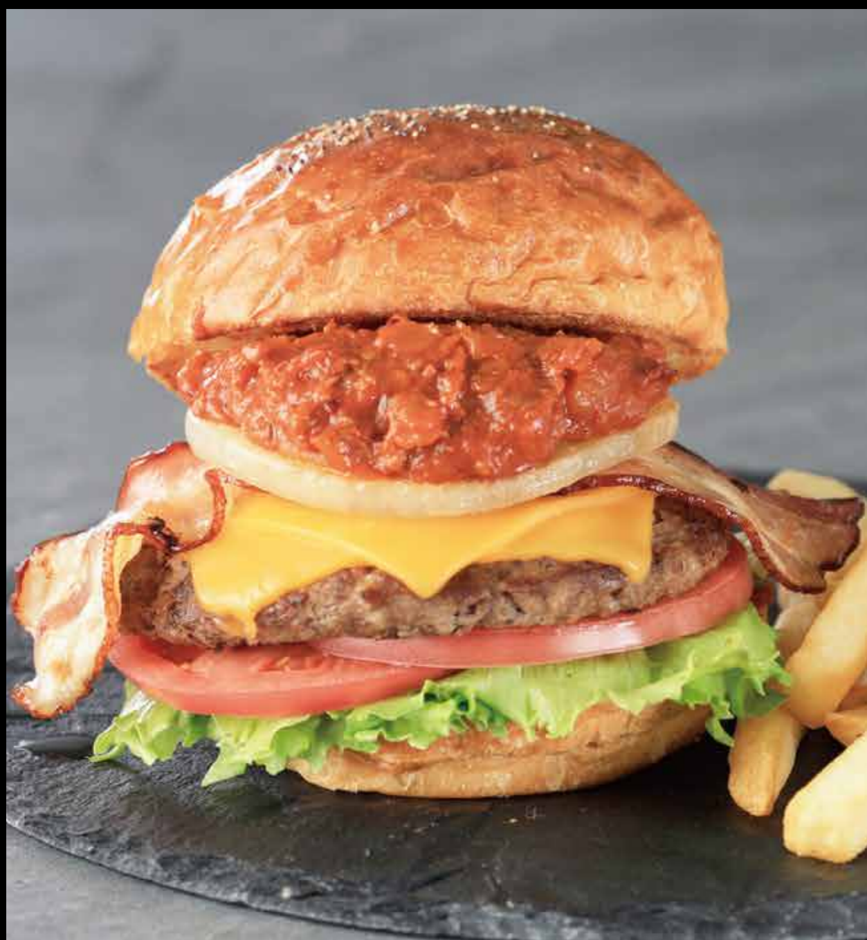
HOT 和牛バーガー モスプレミアム(特製チリミートソース)