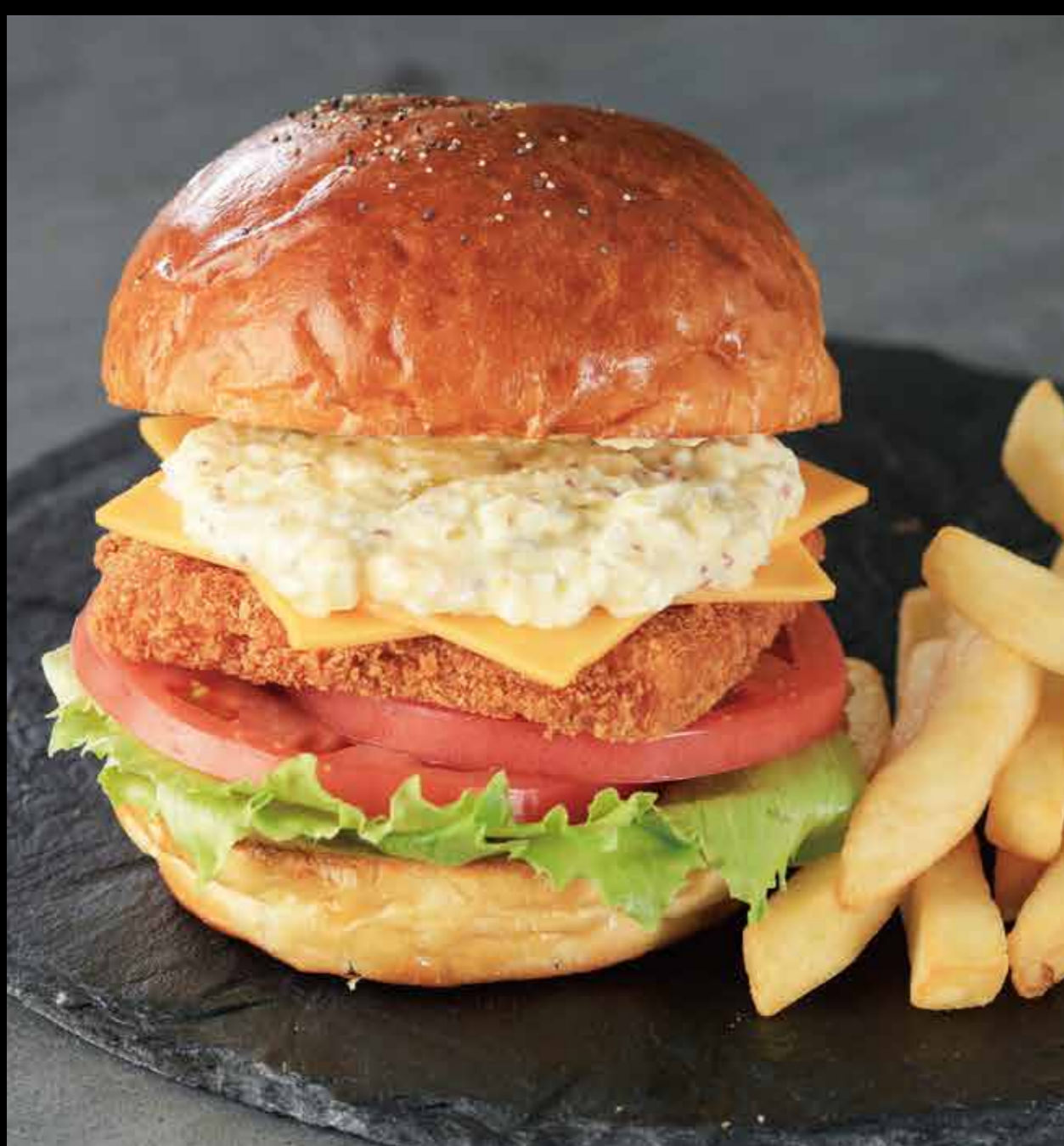
自家製タルタルのフィッシュサンド