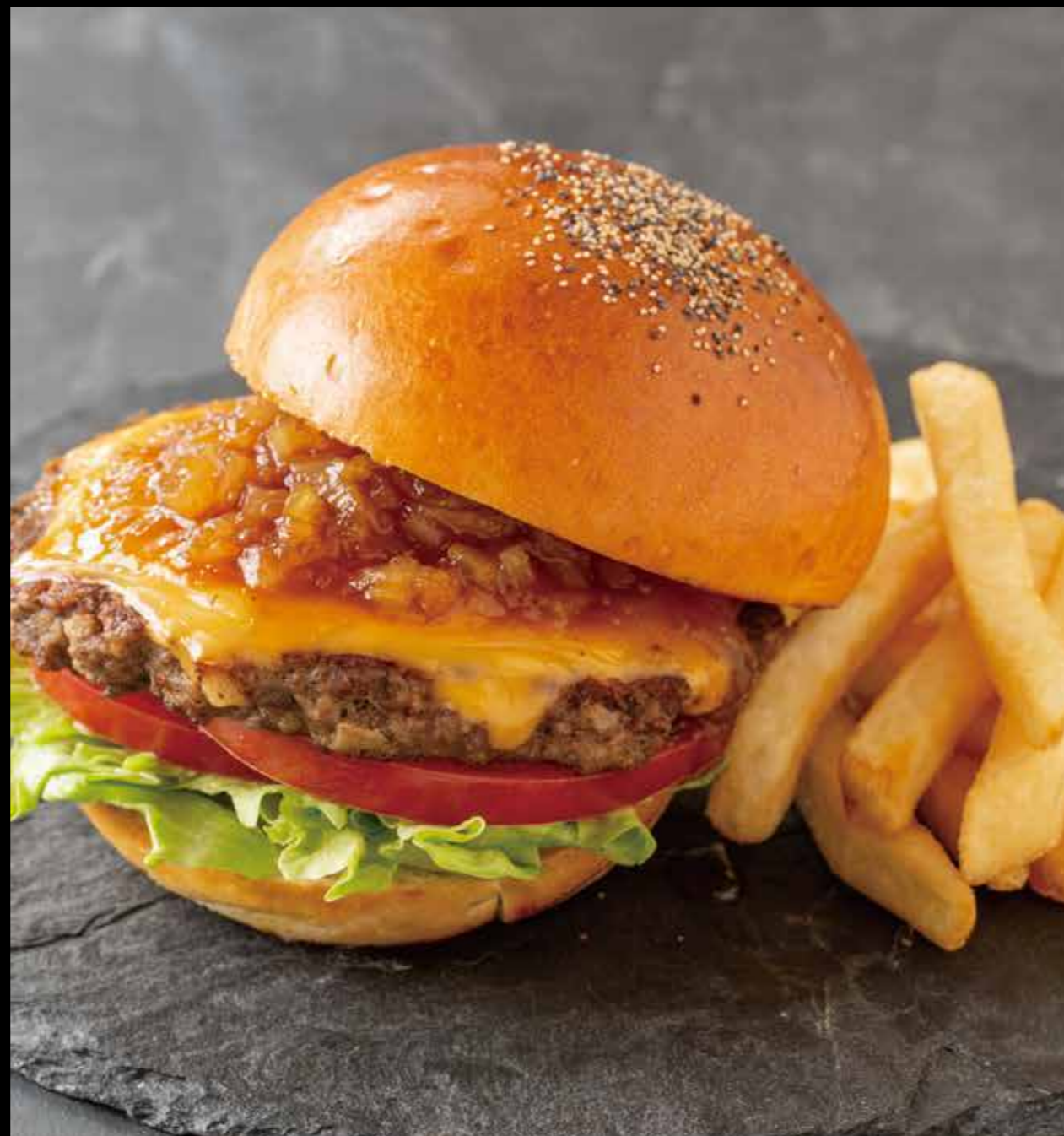
和牛バーガー シャリアピンソース