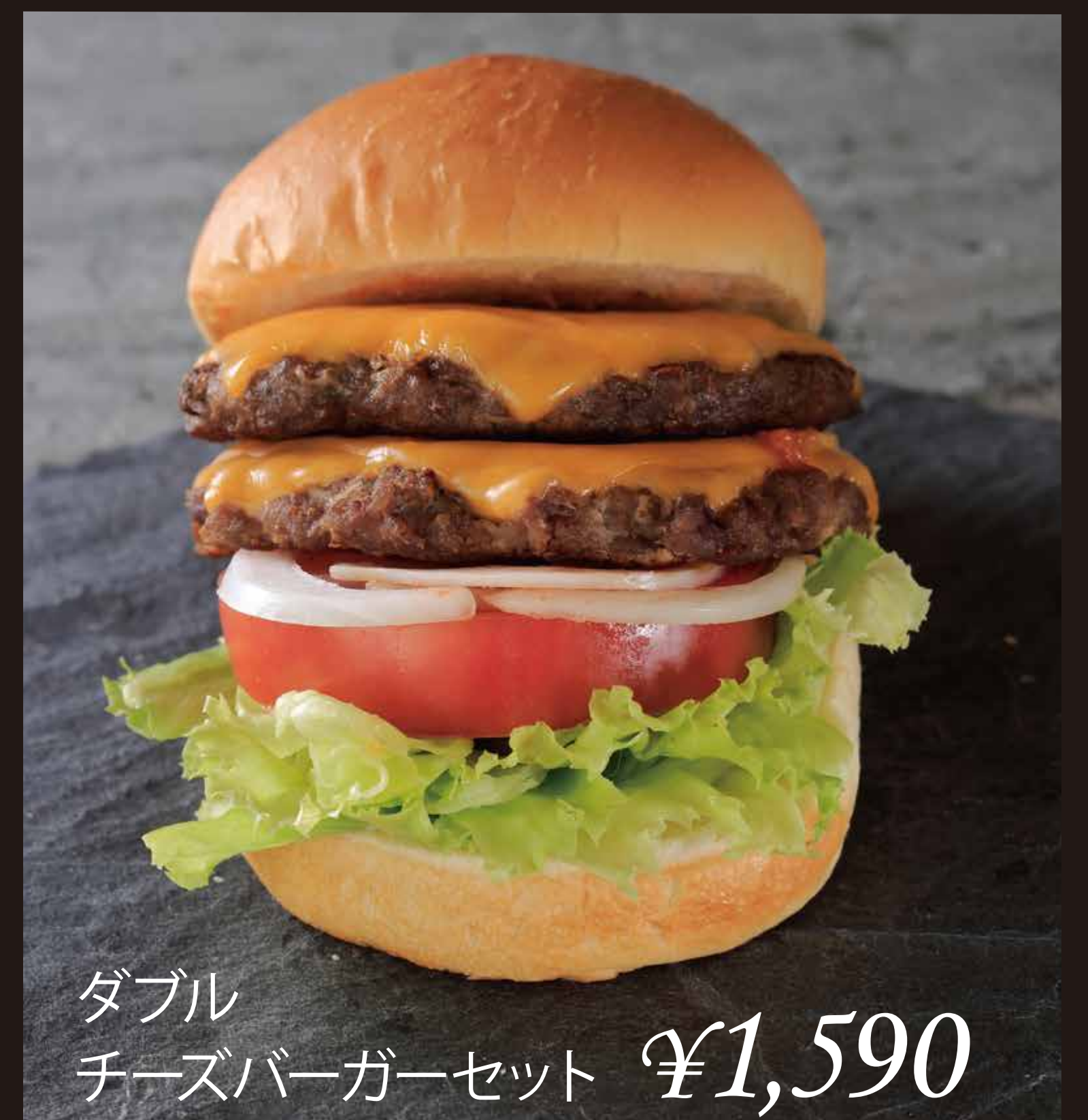
ダブル チーズバーガーセット ¥1,590