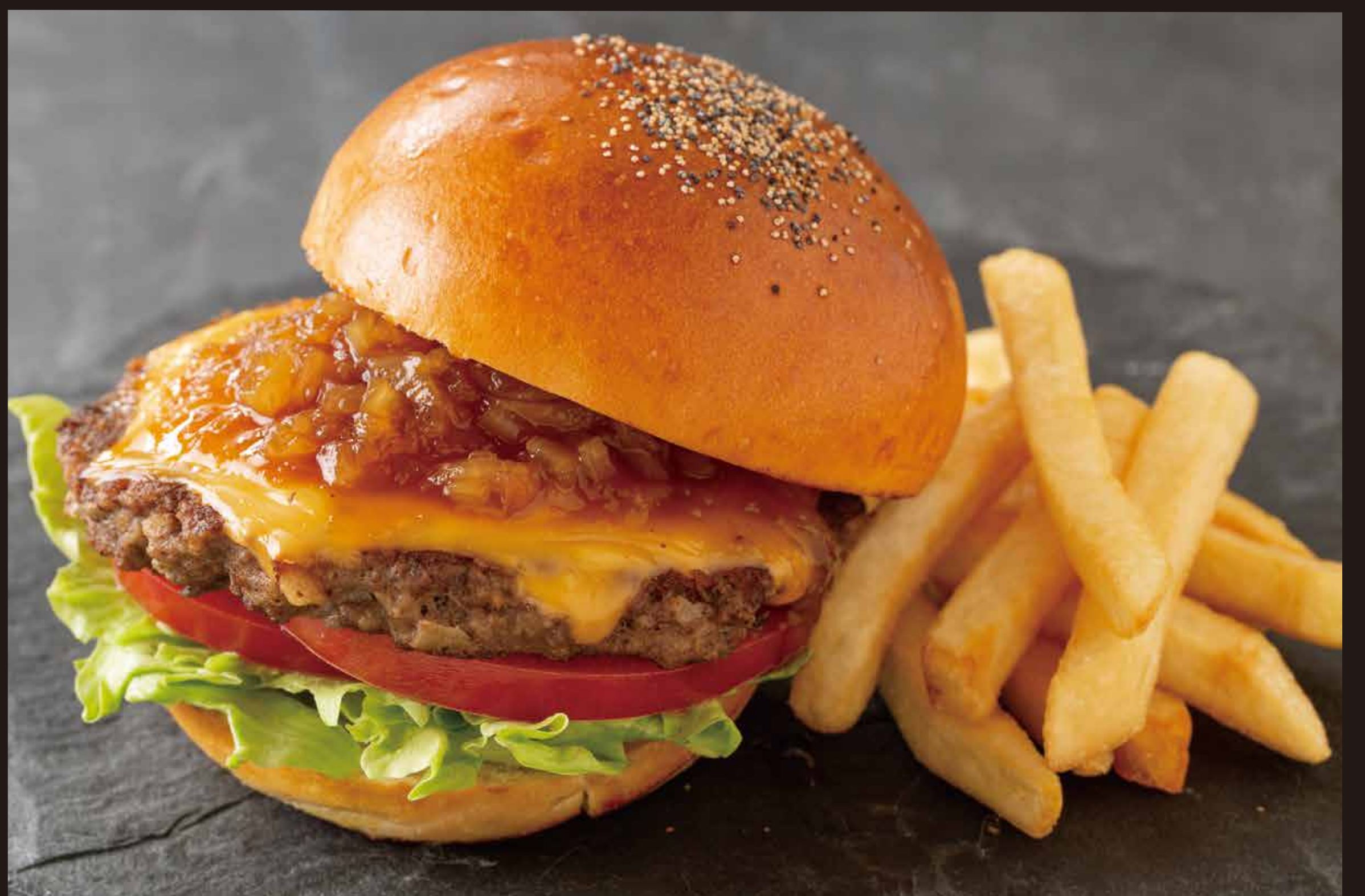
和牛バーガー シャリアピンソースセット