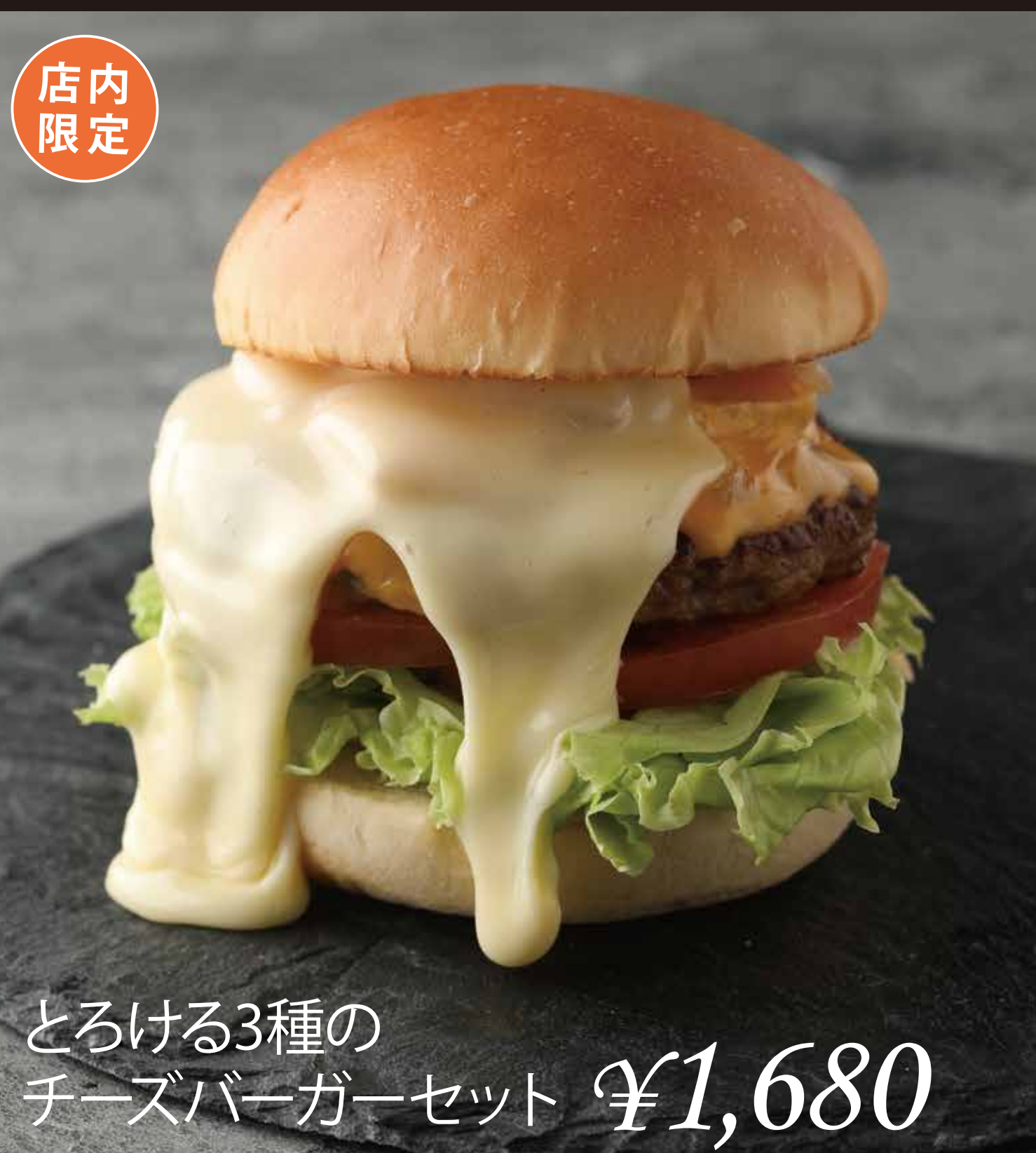
とろける3種の チーズバーガーセット ¥1,680