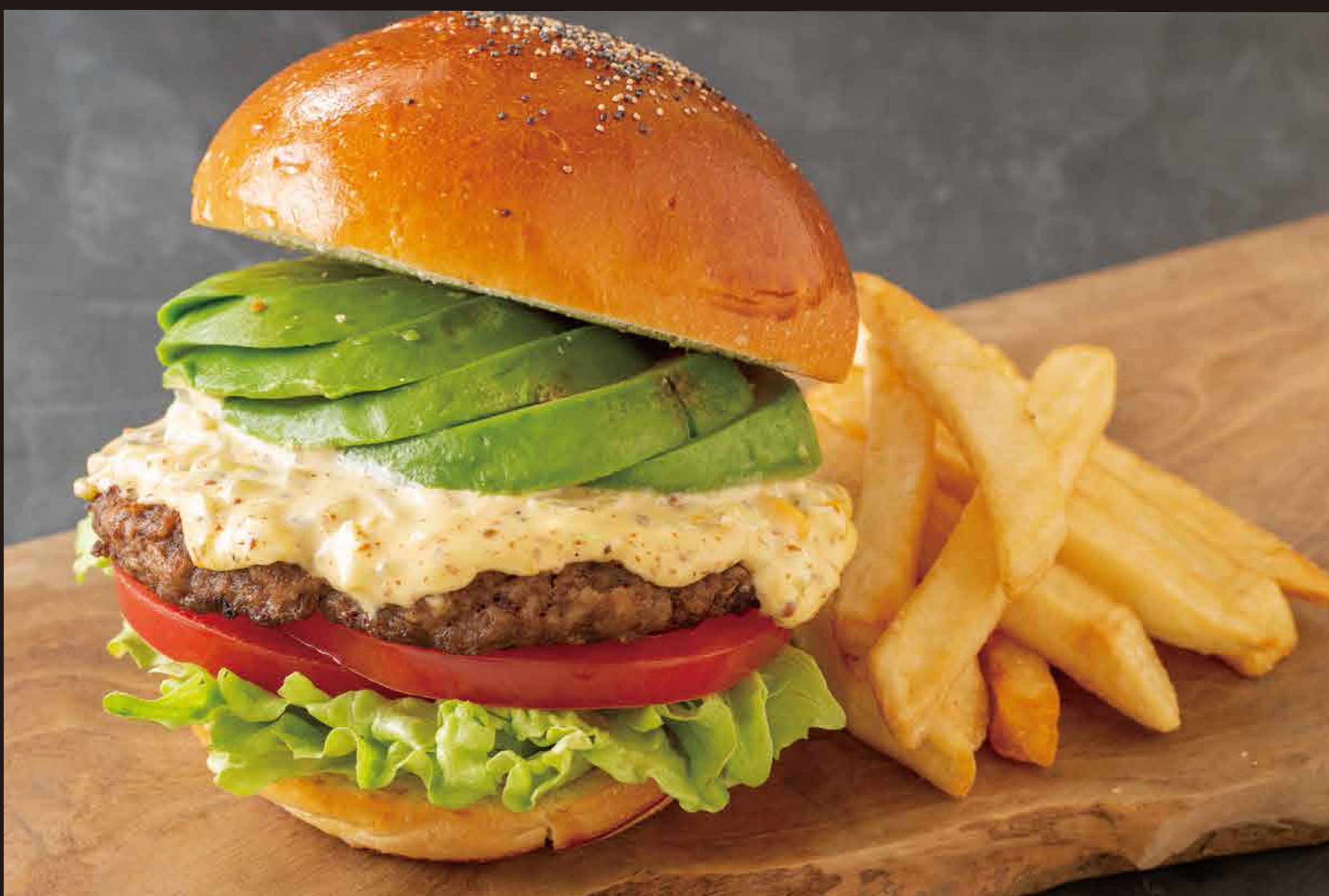
和牛バーガー アボカドわさびセット