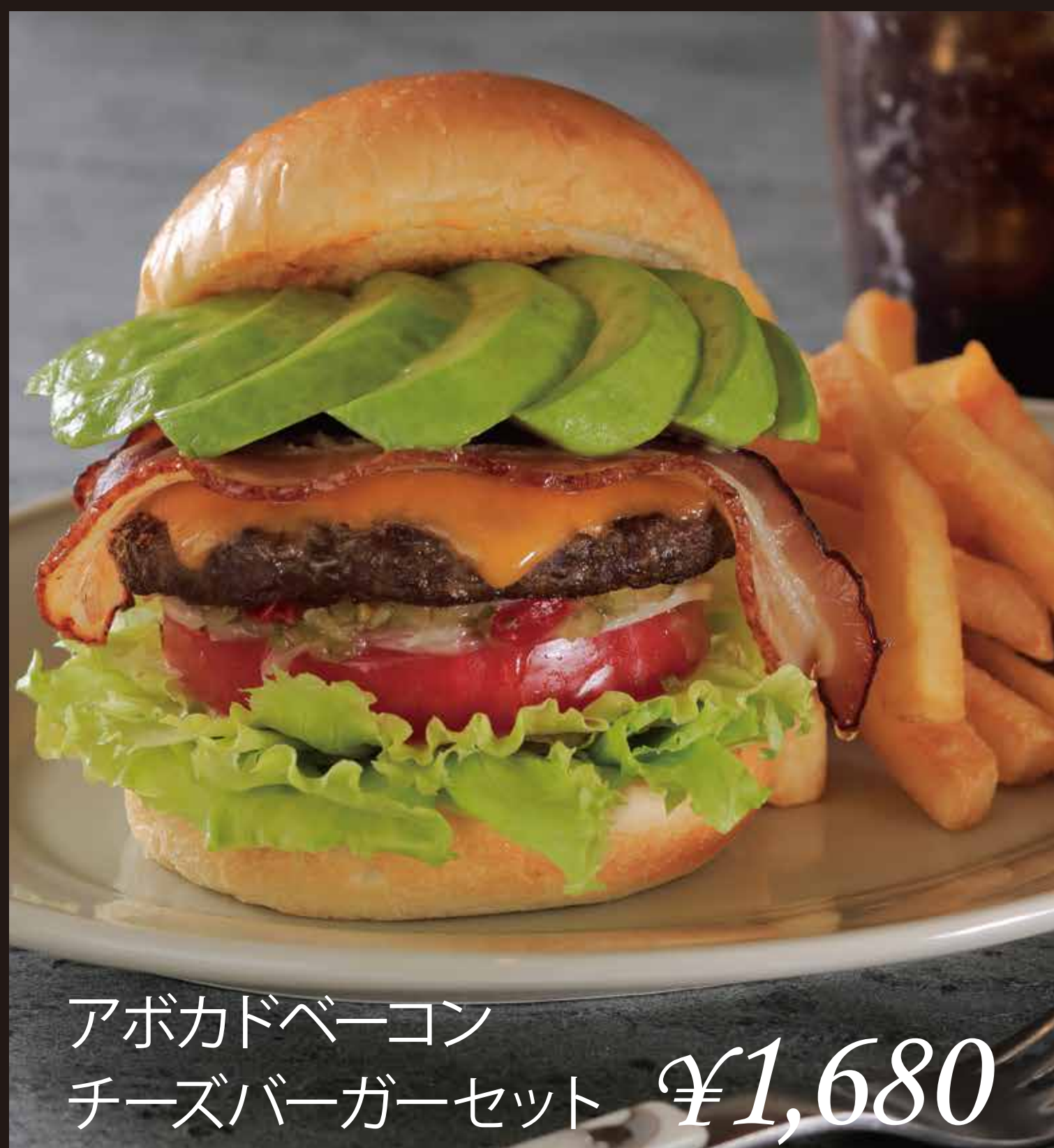
アボカドベーコン チーズバーガーセット ¥1,680