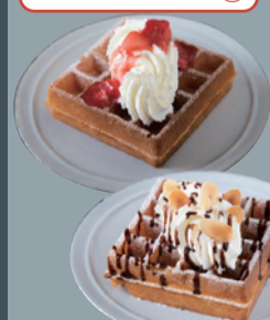
デザート ワッフル (ベリー/チョコレート)