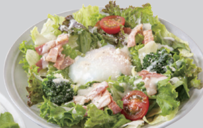
温玉シーザーサラダ (シーザーサラダドレッシング)