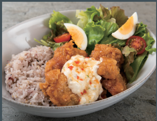
雑穀ごはん甘辛チキン (スープ付)