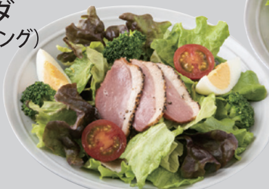
温玉シーザーサラダ (シーザーサラダドレッシング)