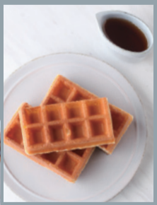
プレーンワッフル 3カット (紅茶シロップ付)