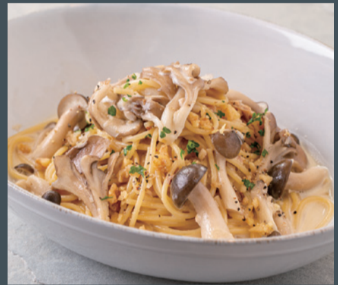
ポルチーニ香るきのことクルミのチーズクリームパスタ