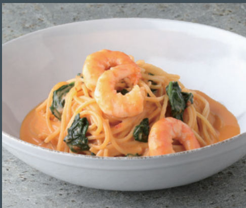
海老とほうれん草のアメリカーナクリームパスタ