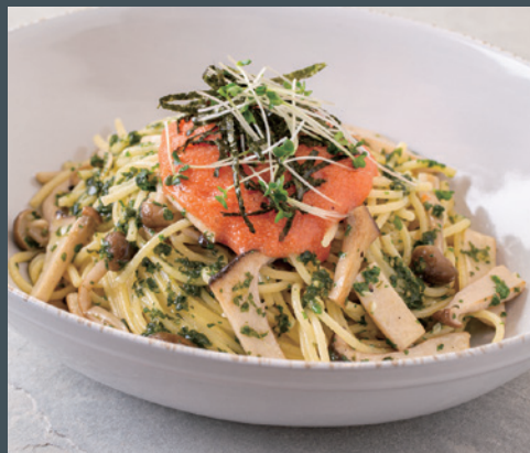
特製大葉ソースときのこの明太子パスタ