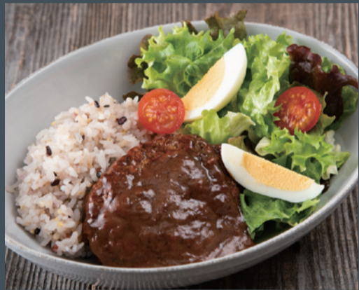
雑穀ごはんハンバーグ (スープ付)